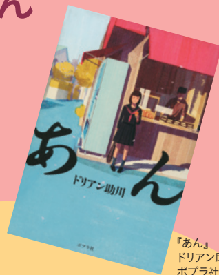
『あん』 ドリアン助川／著 ポプラ社

1962年東京生まれの神戸育ち。作家・朗読家。早稲田大学第一文学部東洋哲学科卒業。放送作家を経て、1990年バンド「叫ぶ詩人の会」を結成。ラジオ深夜放送のパーソナリティとしても活躍。小説『あん』は河瀬直美監督により映画化され、2015年カンヌ国際映画祭のオープニングフィルムとなる。また小説そのものもフランス、イギリスなど12言語に翻訳され、2017年にはフランスの「DOMITYS文学賞」と「読者による文庫本大賞」の二冠を得る。