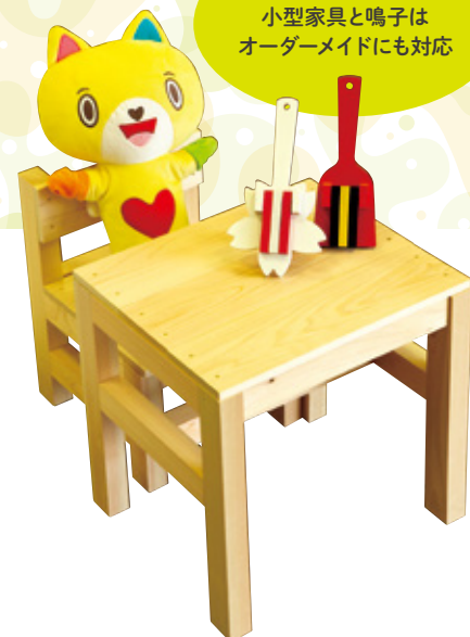
棚や椅子などの 小型家具と鳴子は オーダーメイドにも対応

例えば一人でいろんな作業をこなせる人もいれば、できることは少ないけれど丁寧に仕事をする人もいます。そこで、製作工程が20以上もある鳴子作りでは、それぞれ特性にあった作業を担当してもらいます。自分は任された一部分をやっているけれど、それが次々と流れていって製品として完成する。みんなで協力してひとつのものを作り上げる喜びも、仕事の中で共有しています。