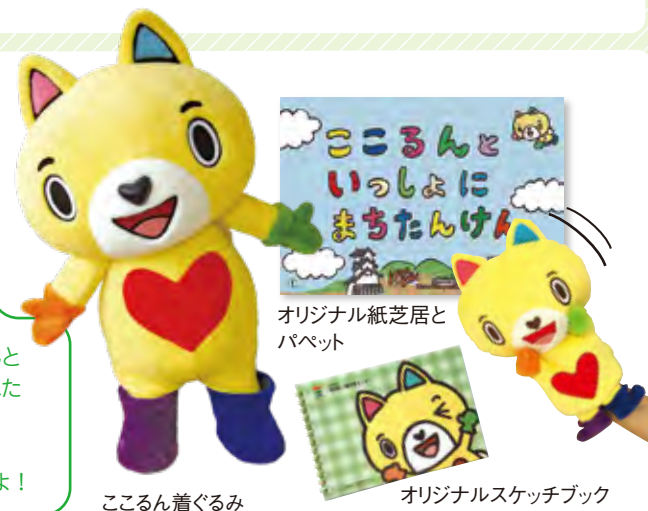
こころん着ぐるみ

貸出利用でこころんとお友達になってくれたみんなには、スケッチブックもプレゼントしているよ！