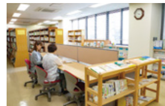
5F じんけんライブラリー

小・中学校、高等学校ほか、地域や団体、イベント開催などにあわせて、様々な人権問題についての図書の団体貸出を行っています。ご希望の図書について、お気軽にご相談ください。