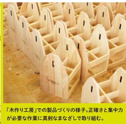
「木作り工房」での製品づくりの様子。正確さと集中力が必要な作業に真剣なまなざしで取り組む。