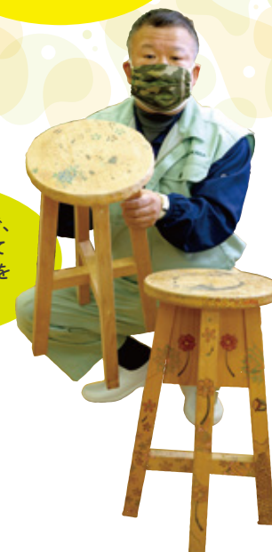
絵を書くのが得意で、 休憩時間を利用して 絵入りのマイチェアを 作った方も！