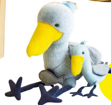
のいち動物公園の 人気者・ハシビロコウの ぬいぐるみは、 縫ぬい工房の作品