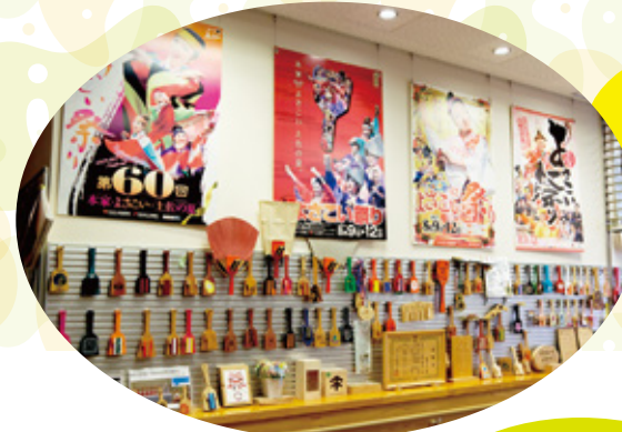
1階ロビーには これまでに制作した 鳴子が展示されているよ